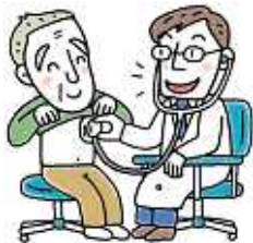
荒川区の患者数上位疾病