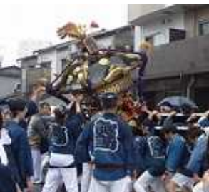
天王祭も雨でしたね... スカイツリーも全く見えない日が続いています

また、今話題の国立競技場の解体工事も入札不調に終わり、2回目の入札を行うようで、解体時期が延期されることになっています。