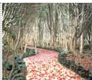
右は、萩市笠山の椿の 原生林 下は我が事務所 前のヤブツバキ…

の敷地に約2万5千本のヤブツバ キ(密集度で世界一)があり、例 年2月下旬～3月下旬頃に花の見 頃を迎え椿まつりも開催されてい ます。かく言う私もこの時期にいっ たことがありません。実は、その 存在も上京した後知りませんでした。 住んでいるところの風景は当たり前 に見え関心も示さないものです。 住んでいる町を、別の目で再発見 することも大事です。横山幸次