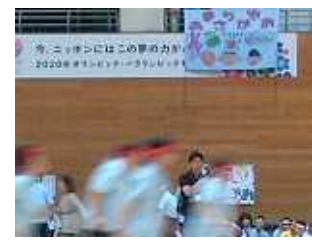
みんな力一杯...! 元気なかけ声と笑いに溢れた運動会でした。

弁護士と横山区議が相談をお受けします。秘密は厳守します。お急ぎの場合は、北千住法律事務所の相談日などご紹介いたします。 生活相談は、随時受け付けています。 TEL&FAX 3895-0504 不在時は、留守電へ、後で連絡します。 区役所控室 3802-4627