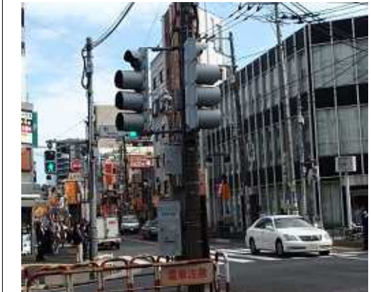
電柱地中化が町をどう変えていくのか...?

まちの話題あれこれ 先日町屋駅側に東京都の表示で「尾竹橋通り電線共同溝」工事の行程表が出ていました。いつかいつかと待っていました。いつかいつかで見えてきました。平成30年・2018年には完成するようになっていきます。尾竹橋通りも北側の半分は早くに地中化できましたが、町屋駅までの半分は地下埋設物などあって工事が長引いてきました。しかし、やっと目処ついたというところでしょう。しかし、今日も夜9時過ぎの尾竹橋通りでは、