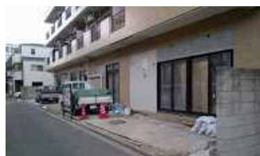
上は、開設準備を進める町屋2丁目駅前保育園、下は町屋1丁目の旧時代の湯跡地のマンション建設現場...