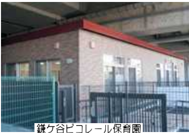
鎌ヶ谷ピコレール保育園

グ保育園）、新鎌ヶ谷駅などに高架下保育園を建設し 保育園業者に貸ししています。 同時に、高架下の他の部分の活用形態と保育園との調和も大事にした取り組みを求めたいと思います。