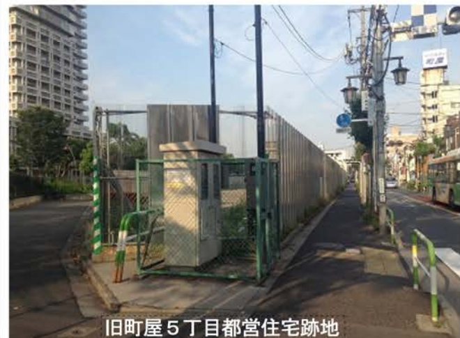
旧町屋5丁目都営住宅跡地

さらに思うことがあります。東 京都と荒川区は、向かい側の町屋 4丁目など不燃化特区に指定し、 2020年に向けて生活道路拡幅 などを進めようとしています。が、 町屋地域での事業は遅々として進 んでいません。複雑な権利関係な どありますが、移り住む住宅の不 足も大きな要因です。東京都は、 危険地域の判定や特区の指定を行 うものの、建て替えや住み替えの