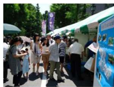
昨年の様子と今年の催しの一部

弁護士と横山区議が相談をお受けします。秘密は厳守します。お急ぎの場合は、北千住法律事務所の相談日などご紹介いたします。 生活相談は、随時受付しています。 TEL&FAX 3895-0504 不在時は、留守電へ、後で連絡します。 区役所控室 3802-4627