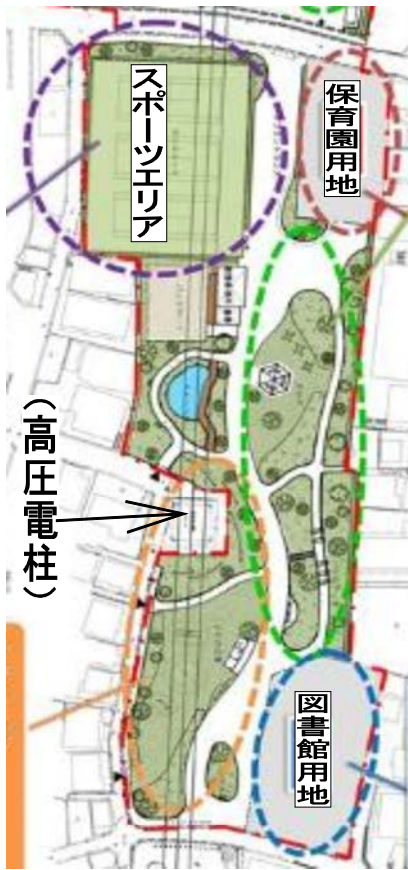
宮前公園周辺地域の公共施設更新イメージ