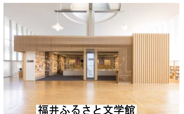
福井ふるさと文学館