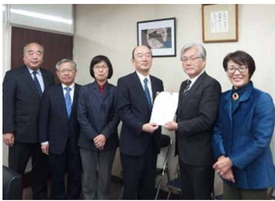
北川副区長に予算要望を手渡す