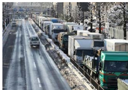
☆2日めの渋滞する道路。子ども作ったかまくらもどきもや雪景色もあるのですが…

雪国の方から見ると笑われるかもしれませんが、今回の4年ぶりの積雪が大都市の災害への脆弱性を示すことになってしまいました。翌日も物流が滞り、スノーバーなどで一時的ですが品薄状態になっていたようです。陸路も、空路も大混乱が長く続いたのです。しかし考えれば自然に溶けて回復に向かって行きます。これが大地震による倒壊や道路の寸断の場合はまったく事情が違ってきます。巨大都市で幹線とともに狭隘