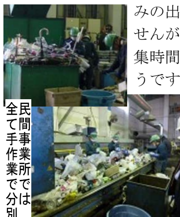
民間事業所で分別して手作業で分別

月2回収集の不燃ごみ(傘、瀬戸物ガラス、アルミ箔アルミ皿、包丁・ナイフ等刃物、使い捨てカイロなど)は、現在、北区の堀船中継所から船で輸送し、23区清掃一部事務組合の方で資源回収したのち埋立処理をしています。今回、隅田川護岸工事で、この船中継所が3月末で休止することもあり、昨年9月から不燃ごみの2割を民間施設(足立区の事業者)に搬入し資源化の準備をすすめ、4月から荒川区として、不燃ごみ全量の資源化を行うこととなります。不燃ご