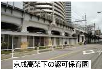
京成高架下の認可保育園