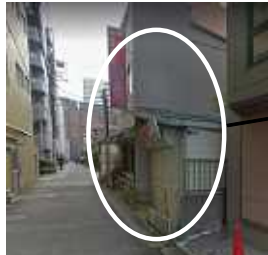
町屋2丁目計画されている私立認可保育園用地