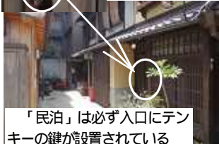
「民泊」は必ず入口にキーの鍵が設置されている

先日、京都市東山区の「民泊」問題を視察。東山区といえば、世界的観光都市の中心・清水寺などに多く世界中から観光客が訪れる地域です。同時に木造密集地域でもあります。そこに次から次へと住宅を改造した旅館業法に基づく「簡易宿所」(右下・改造中の住宅)が路地の奥まで出現している様子にビックリしました。また、それ以外にもいわゆる違法「民泊」があちこちに...。地元の方は、「これではまちが壊れる」「住民が住めないまちになる」と危機感が広がっています。自治体の規制がどうしても必要と痛感しました。