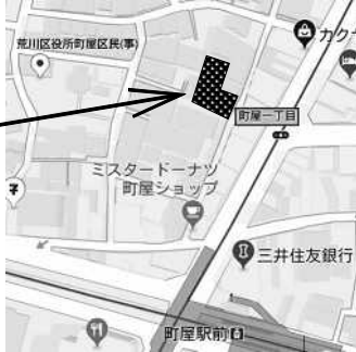
2018年3月現在の区内保育施設整備状況・計画