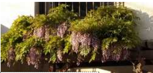
上は、軒先に咲いた藤の花。下は横山事務所前の植え込みのつつじ...!

弁護士と横山区議が相談をお受けします。お急ぎの場合は、北千住法律事務所の相談日などご紹介いたします。 生活相談は、随時受付しています。 TEL&FAX 3895-0504 不在時は、留守電へ、後で連絡します。 区役所控室 3802-4627