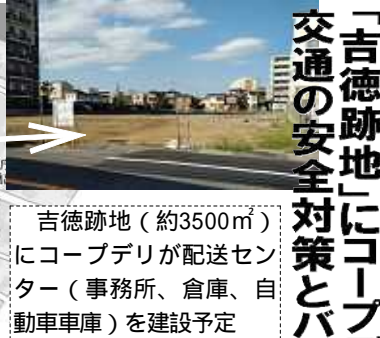
吉徳跡地 (約3500㎡) にコープデリが配送センター (事務所、倉庫、自動車庫) を建設予定