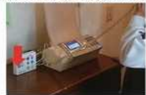
設置イメージ サイズ幅約10F、奥行約12F、奥行約3Fで場所もとりません。

10%が強行されたならば家計も一刻も早く安倍政権にお引き取り願うしかありません。