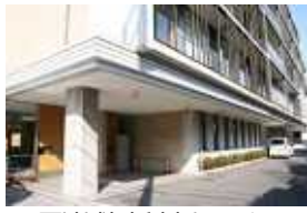
町屋地域包括支援センター

本人の状態や意思をくらしの美態も示し、区議会では、高齢者の党区議団は、毎回の区議会で、高齢者の