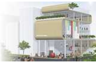
上は、日暮里活性化施設完成図、右は、現在の尾久図書館