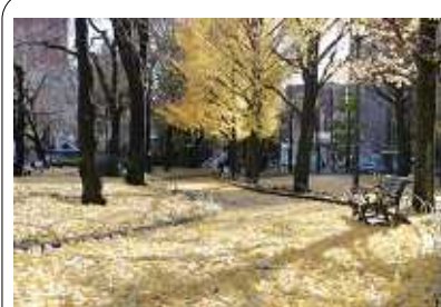
下は、今の区役所前の様子。上は、 昨年のイチヨウの落ち葉…。