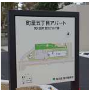
すでに町屋5丁目アパ ートの案内版もできています