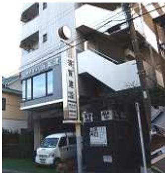
上が、須賀建設、下は区本庁舎裏の倉庫改修工事現場（現在工事はストップ）