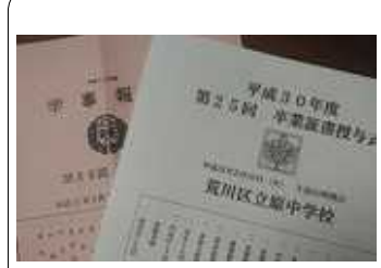
上は、各校の学事報告 下は、原中の美術製作の「卒業おめでとう」のデコレーション

弁護士と横山区議が相談をお受けします。お急ぎの場合は、北千住法律事務所の相談日などご紹介いたします。 生活相談は、随時受付しています。 TEL&FAX 3895-0504 不在時は、留守電へ、後で連絡します。 区役所控室 3802-4627