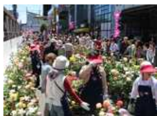
昨年のバラの市の風景と今年の都電とバラ