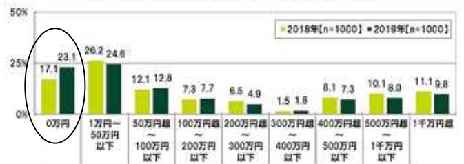
Q.現在貯蓄できているお金のいくらかあるか？ (数値入力回答: 万円)

SMBコンシューマーフィナンシャル株式会社が「三井住友系」が発表した「30代・40代の金銭感覚についての意識調査2019」で30代・40代の貯蓄額「貯蓄ゼロ」が昨年比6ポイント上昇の23%に、平均額も52万円減少していることがわかりました。また100万円以下までの合計は60.5%となり多数派です。また、400万円以上が前年比で減少していることも特徴です。原因は、単に「金銭感覚」や「意識」だけでなく、非正規雇用の増大による収入の減少などの影響もあるのではないのでしょうか。