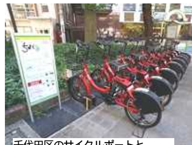
千代田区のサイクルポートとそのシステム図（下）