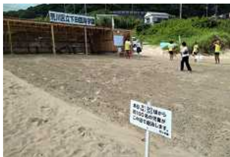
上は、外浦の海水浴場にある区施設 下は臨海学園の宿泊施設

弁護士と横山区議が相談をお受けし ます。お急ぎの場合は、北千住法律事 務所の相談日などご紹介いたします。 生活相談は、随時受付しています。 TEL&FAX 3895-0504 不在時は、留守電へ、後で連絡します。 区役所控室 3802-4627