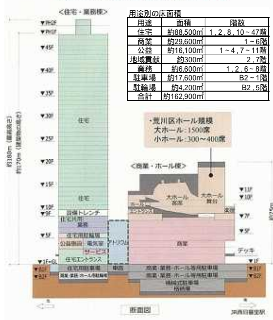
現時点での行政等協議を踏まえた施設計画(案)

まちづくりの優先順位が問われています 区民にとって必要な住宅や公共施設は何？ 区議会9月会議で大きな論点になったのが、区のまちづくり、とりわけ西日暮里駅前再開発の是非についてです。 公共施設は「大ホール」？ 区は、西日暮里駅前再開発を都市基盤整備の最優先課題と位置づけ、1000戸の住宅建設、事業費190億円(全額区負担)規模の大ホール建設を推進しようとしています。 この開発区域には、旧道灌山中跡地、現行の区立保育園、高齢者通所サービスセンターという区の施設や用地があります。荒川区にとっては、貴重な用地であり、財産です。ここにどういった区民のため の施設が必要なのか？今後の学校をはじめとした建て替えなどで使う必要はないか？など区民の声を聴いて対処すべきです。 マンション1000戸・住宅困窮者への対処なし また、今回も1000戸のタワーマンションが中心の開発。当然、総事業費の3割程度税金が付き込まれます。その一方で、高齢者住宅登録でも表れているように、区民の住宅困窮への支援が極めて不十分です。高齢者や母子世帯などの住宅困窮者へ対策は、直接支援はありません。 荒川区には、住宅対策を専門に扱う課がありません。や