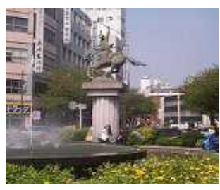
上は再開発前の日暮里駅

生活相談は、随時受け付け TEL&FAX 3895-0504 不在時は、留守電へ 後で連絡します。 区役所控室 3802-4627