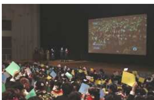
タイムスリップクイズに参加する新成人

今年荒川区で成人を迎えた若者は、2121人。その内外国籍の方は、576人約3割に達しています。多様性を受け入れ共に生きる地域社会がやはり重要です。13日の「成人の日のつどい」への参加者は、1057人でした。半数の参加ですが、会場では、旧友との再会を喜ぶ笑顔、恩師のビデオレターに感動する場面など見られました。参加しなかった(できなかった)半数の新成人は、どういった一日だったのでしょうか。少々気になるところです。 成人年齢については民法改正で2022年4月以降、今の20歳から18歳に引き下げられることがすでに決まっています。では成人式は、どうなるのでしょうか。各自治体で対応は様々です。「二十歳のつどい」にするところもありますが、未定が多いようです。 生きづらさが広がる中で、自ら未来を切り拓くため若者が声を