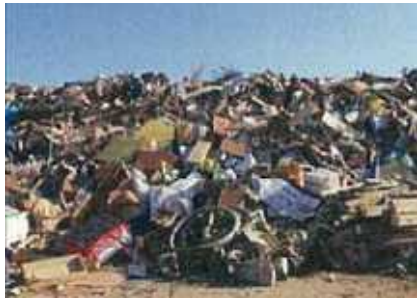
災害廃棄物の集積所（参考）

区の想定では、7・3の首都直下地震で154万トンのがれき（コンクリートがら、木や金属のくず、その他の可