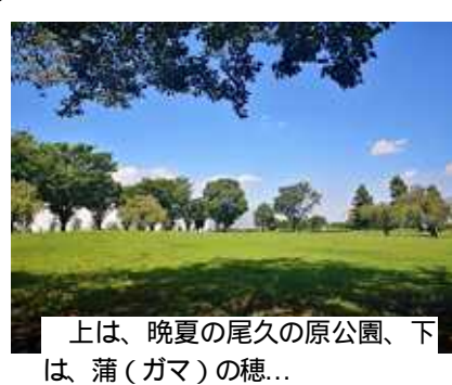
上は、晩夏の尾久の原公園、下は、蒲(ガマ)の穂...

定例法律相談会 10月5日(月) 横山事務所18時~20時 弁護士と横山区議が相談をお受けします。お急ぎの場合は、北千住法律事務所の相談日などご紹介いたします。 生活相談は、随時受付しています。 TEL&FAX 3895-0504 不在時は、留守電へ、後で連絡します。 区役所控室 3802-4627