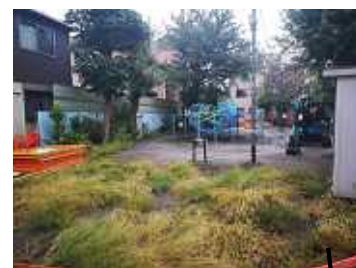
上は工事直前の公園、下は、現在の様子…