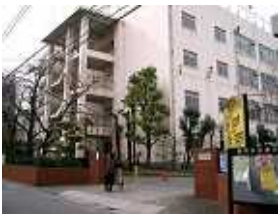
西日暮里駅前再開発 計画変更(案)