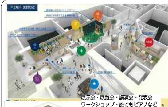
展示会・展覧会・講演会・発表会 ワークショップ・誰でもピアノなど