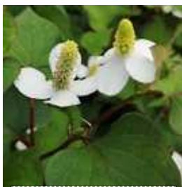
上はドクダミの花、 下は事務所側の群生...

東京には、まだ梅雨入り宣言は出ていません(このニュースが届く頃には入梅?)。しかし、街の路地や公園、空き地などに季節の変化を告げる花が見られます。梅雨といえば、様々な形、色を織りなす紫陽花が代表格でしょう。そんなおり、事務所の横の空き地に毎年のように咲いているドクダミを眺め、名前とは裏腹な可憐な花を接写したりしていました。ふと考えるとドクダミにはいつもこの季節に花をつけます。調べると5月ころから夏にかけて花をつ