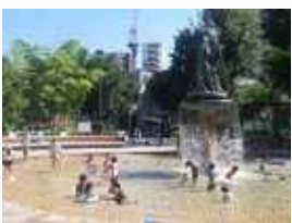
日暮里南公園、天王公園、下は尾久の原公園のじゃぶじゃぶ池

先日、尾久の原公園を訪れるとじゃぶじゃぶ池に多くの子どもたちと周囲でも見守る大人の姿が見られました。夏の日常の風景なのですが、しかし、いまは、コロナ禍です。感染予防対策で密を避けることが求められています。区立公園でじゃぶじゃぶ池があり水遊びができるのは天王公園と日暮里南公園ですが、当初区は、感染対策としてじゃぶじゃぶ池の使用を中止していました。しかし、多くの区民から利用の要望が