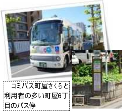
コミバス町屋さくらと利用者の多い町屋6丁目のバス停

10月18日開催の建設環境委員会に「コミユニティバス」町屋さくら」廃止の報告がありました。荒川区のコミユニティバスは、京成バスの自主運行で、区の補助金なしで運行しています。今回京成バスから「町屋さくら」について、以前から収益が経費の30%、コロナ禍で一層の利用者・収益とも減少、今後の収益の改善が見込まれないなどの理由で来年3月末で路線廃止の申出て、区も同意しました。もともと京成バスの自主運行であり、大きな赤字となれば当然、事業撤退はありえます。しかし区がコミバス導入を決め