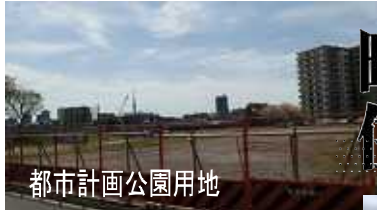
都市計画公園用地