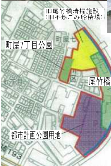
旧尾竹橋清掃施設 (旧不燃ごみ船積場)