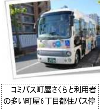
コミバス町屋さくらと利用者の多い町屋6丁目都住バス停