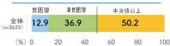
等価世帯収入の水準

内閣府の「子供の生活状況調査の分析 報告書」は、家庭の経済状態の子どもへの影響把握のため、全国中学2年生と保護者5000組を対象に、20年2月～3月に郵送で調査。2715組から回答。その一部をご紹介します。