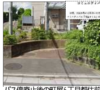
バス停廃止後の町屋6丁目都住前

町屋さくらが廃止されて半年。廃止によって、どれだけの住民が移動を制約され、それまでの日常が奪われたのでしょうか。これまで横山事務所に「廃止されてずっと町屋駅にも行っていない」「グラウンドゴルフに出かけるのも大変」「通院が困難になった」「友達に会ってない」など多くの切実な声が寄せ