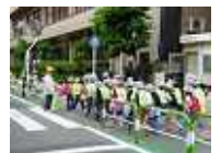
裏面 区立幼稚園の陳情結果、「訂正とお詫び」...など

シルバーの仕事は生きがい就労と位置付けられてきましたが、現在生活費補填の側面が大きくなっているのが現状です。区の仕事は、最低賃金を下回らなくなりましたが、民間の仕事はそうなっていません。ここにも区として要請するよう求めています。また、来年の10月からのインボイス制度導入で「収入の10%課税」の影響が現れます。配分金の減少にならないようにすることを求めています。