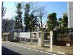
都立王子特別支援学校

しかし東京都が実施しな い中、学校給食の無償化か ら外れた特別支援学校に通 う区内の子どもたちへの支 援を行うことは、区の当然 の仕事ではないでしょうか。 すでに23区でも独自補助を 実施する区が増えています。 年間700万円です。 こうして支援に背を 向ける区の姿勢は大問題で す。区民の暮らしに寄り添 い、国や都の制度で足らな いところに手を差し伸べる ことが地方自治体の仕事は ないでしょうか。