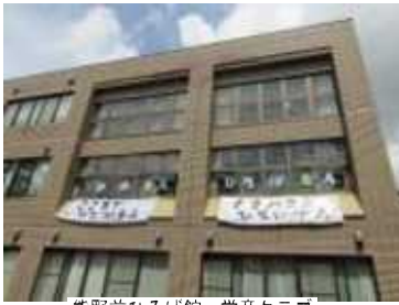
熊野前ひろば館・学童クラブ

区立学童クラブを運営するワーカーズコープが職員配置で虚偽の報告を行い、委託料不正受給した実態が明らかになりました。原因や事実の徹底究明が必要であり、当該事業者の責任は重大です。 同時に不正を行った事業者を切れば終わりにはなりません。区立学童クラブの運営で区も大きな責任があるのです。 今回の学童クラブの不正請求問題は、きちんとした指導、監督も十分でなく、区の責任が果たされていない結果ともいえます。低賃金などきびしい労働条件の中、保育士、学童保育支援員、介護職などの慢