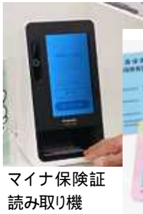
マイナ保険証 読み取り機