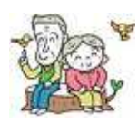
【区内の75歳以上人口】 ( )は100歳以上

今年、区内で1 00歳以上の方は 95人、そのうち1 05歳以上の方も 7人です。 平均寿命は女性の方が6才以 上、100歳以上の方も男性17 人・女性78人で圧倒的に女性 です。 安心して暮らせる社会へ 単身高齢女性の多くが暮らせ ない低年金です。「男は外で働 き、女は専業主婦として家事を する」という誤っ た役割分担が押 しつけなど、受 給額に影響を及ぼ しています。男性 も低年金方が多数