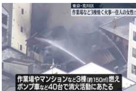
作業場やマンションなど3棟(約150m)燃え ポンプ車など40台で消火活動にあたる